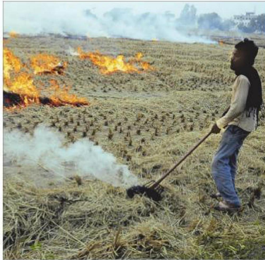
More than 3,000 students and corporate volunteers in the state are joining the CII in this movement.

The intervention is supporting farmer groups to procure a range of farm machinery, including Happy Seeder, Zero Till, Mulcher, etc, and make these avail-